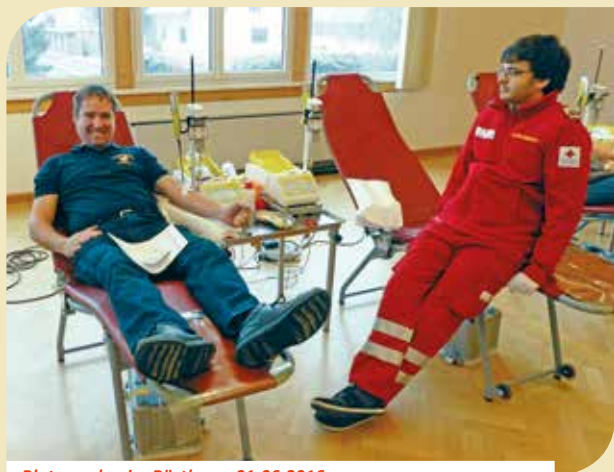
Blutspenden im Rüsthaus, 01.06.2016