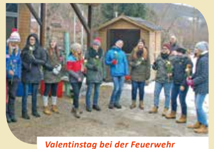
Valentinstag bei der Feuerwehr