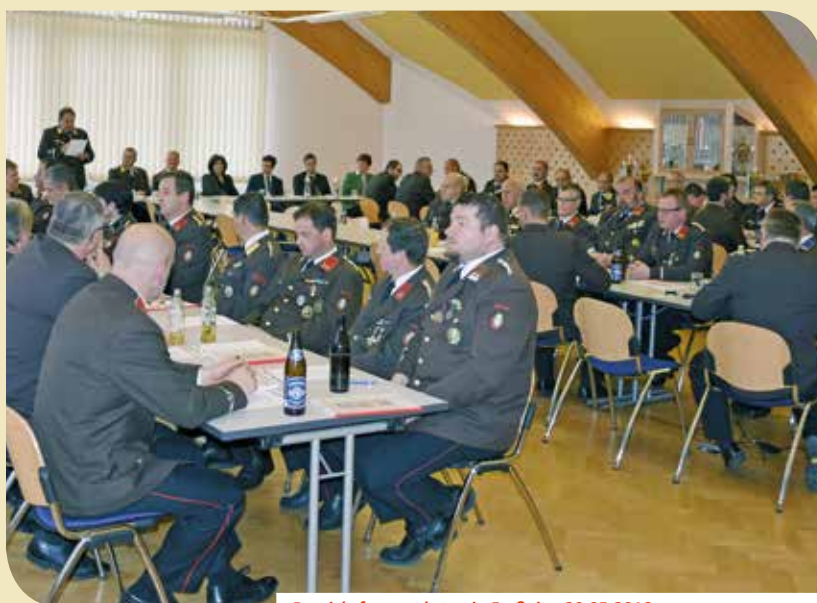
Bereichsfeuerwehrtag in Freßnitz, 20.05.2016