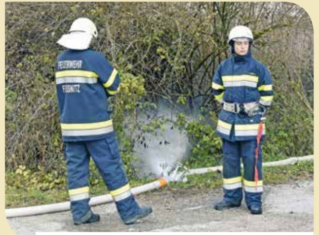
Wir sehen nichts