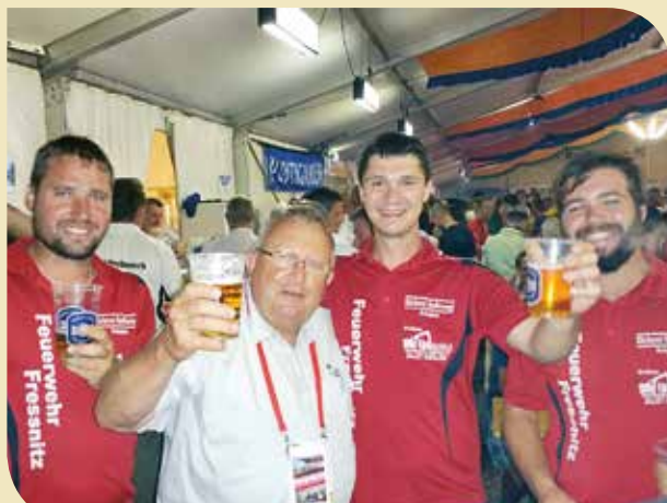
Feiern mit Bundesbewerbsleiter