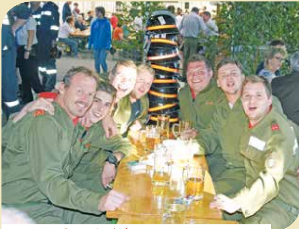
Unsere Freunde aus Hirnsdorf