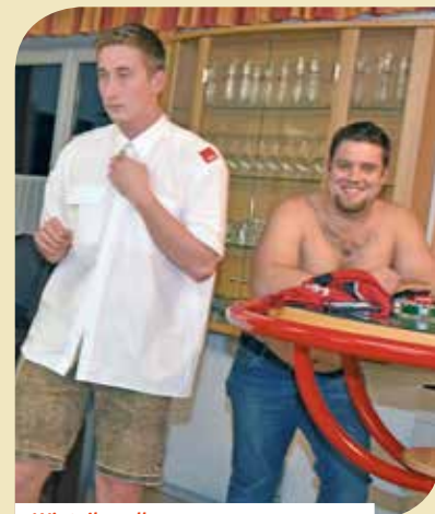
Wir teilen alles