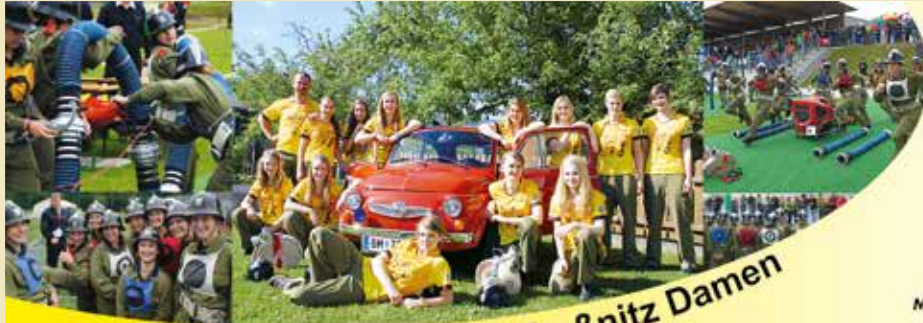
Wettkampfgruppe FF-Freßnitz Damen