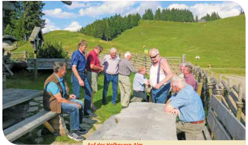
Auf der Hofbauern Alm

Auch waren wir bei diversen Anlässen wie Florianitag, Fronleichnam, ÖKB-Heldenehrung und Feuerwehrübungen mit dabei.