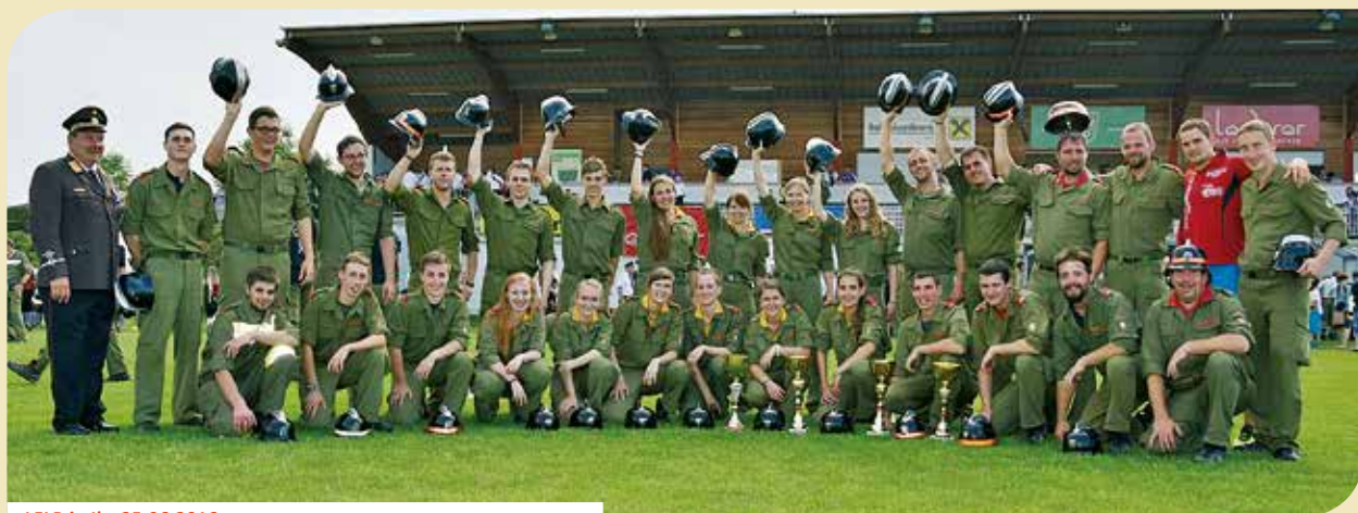
LFLB in Ilz, 25.06.2016