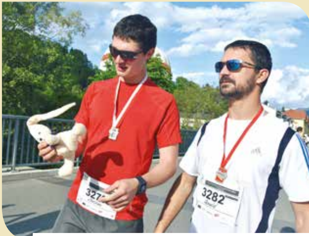
Wenn ich nochmals Papa werde!