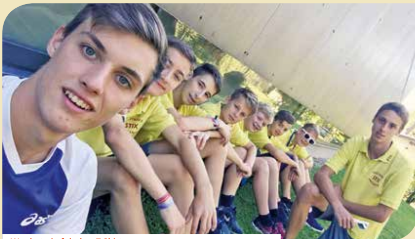
Wer hat ein falsches T-Shirt