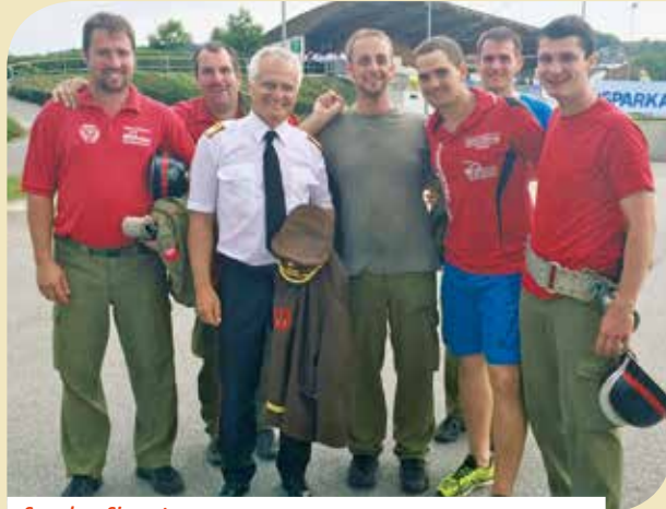
So sehen Siegertypen aus