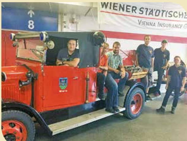
Neues Fahrzeug für 2018