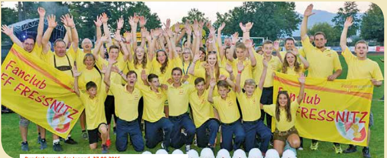
Bundesbewerb der Jugend, 27.08.2016