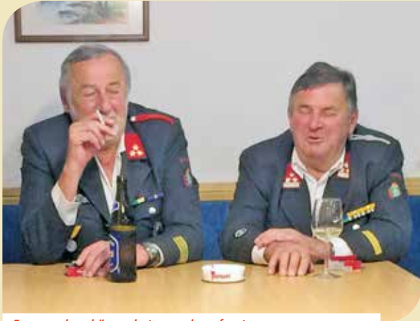
Es war sehr schön, es hat uns sehr gefreut