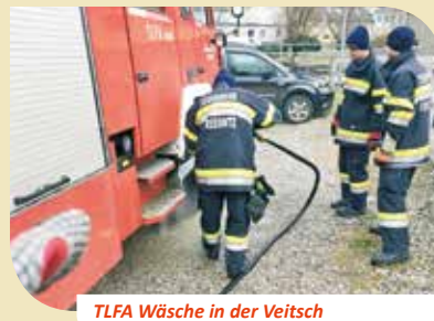
TLFA Wäsche in der Veitsch