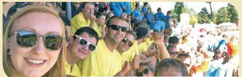
Gesponsert von Fielmann