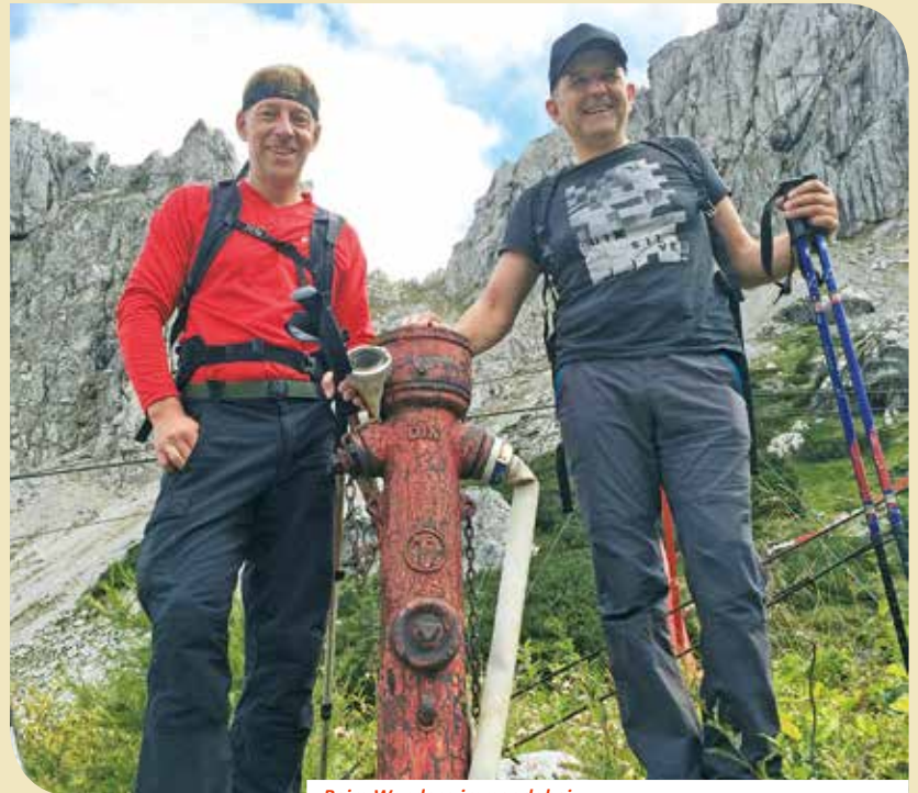
Beim Wandern immer dabei