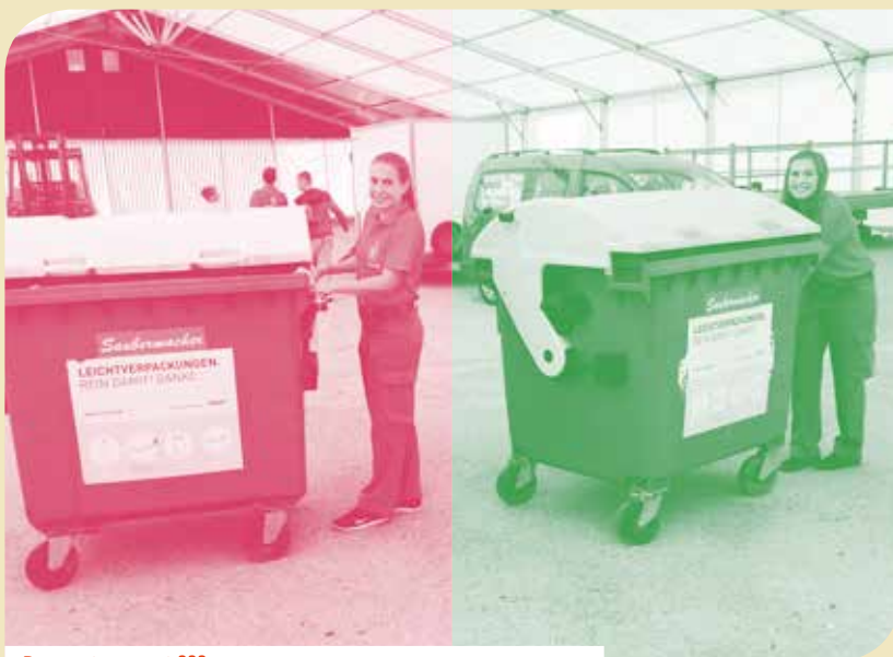
Da passt was net ???