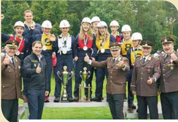
Landessieg der Jugend, 16.07.2016