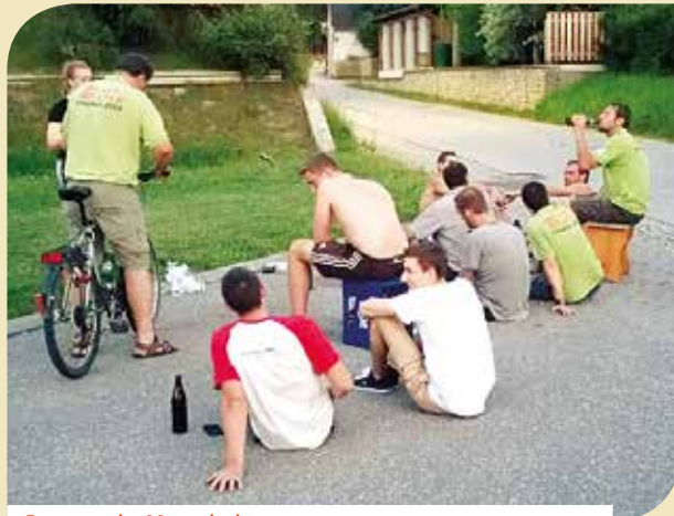
Frau sprach - Mann dachte