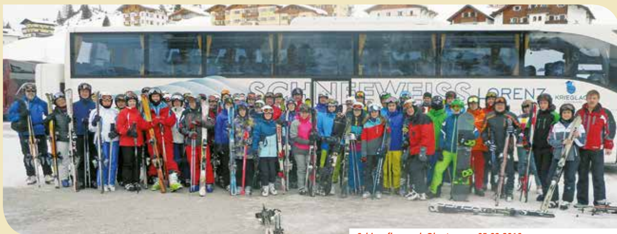
Schiausflug nach Obertauern, 05.03.2016