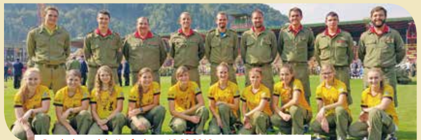
Bundesbewerb in Kapfenberg, 10.09.2016